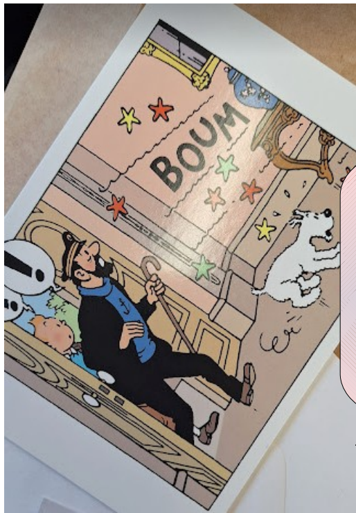
Image prise durant la visite du musée Hergé en Belgique.

Bonjour capitaine, vous aviez l'air bougon à l'idée d'être interviewé alors merci d'avoir accepté cette entrevue. Comment allez-vous aujourd'hui ?